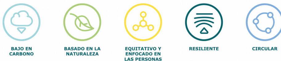
Figura 1. Los cinco caminos estratégicos ICLEI.

ICLEI – Gobiernos Locales por la Sustentabilidad es una red global de más de 2.500 gobiernos locales y regionales comprometidos con el desarrollo urbano sostenible. Activo en más de 125 países, ICLEI influye en las políticas de sostenibilidad e impulsa la acción local para un desarrollo bajo en carbono, basado en la naturaleza, equitativo, resistente y circular. La red ICLEI y su equipo de expertos trabajan juntos ofreciendo acceso al conocimiento, asociaciones y capacitación para generar cambios sistémicos a favor de la sostenibilidad urbana.